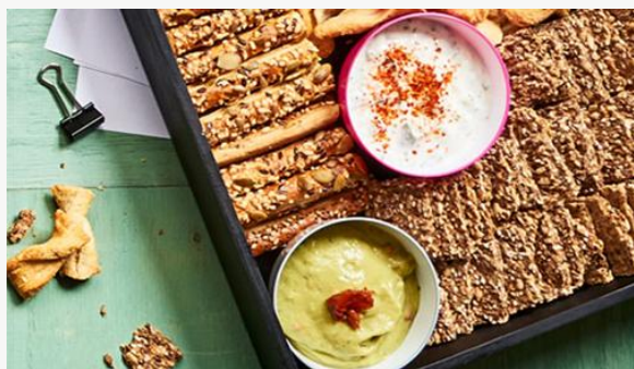
Planche de crackers