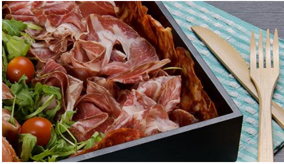
Planche de charcuterie

500 gr – Avec Porc Coppa, Chorizo doux, Jambon Speck Livré avec du pain