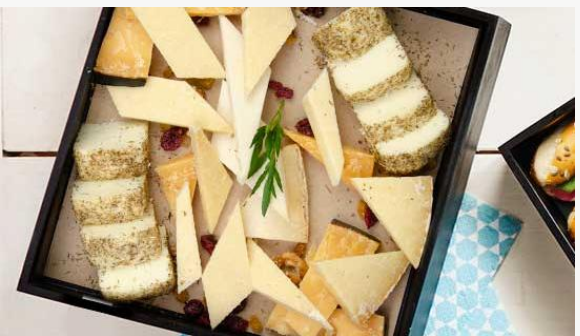
Planche de fromages