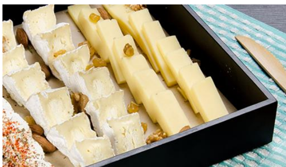
Planche de fromages