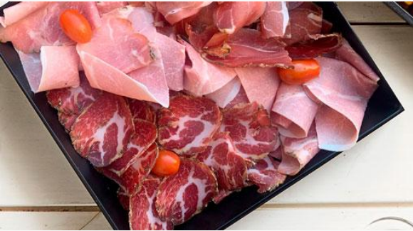
Planche de charcuterie

480 gr – Avec Porc Jambon aux herbes, Saucisson du marin, Speck Livré avec du pain