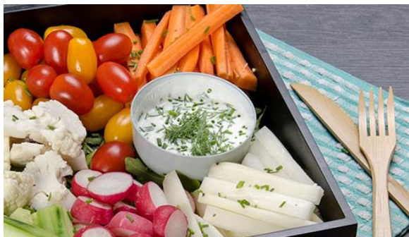
Planche de crudités