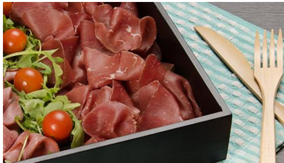
Planche de charcuterie

400 gr – Sans porc Bresaola, Pastrami. Livré avec du pain